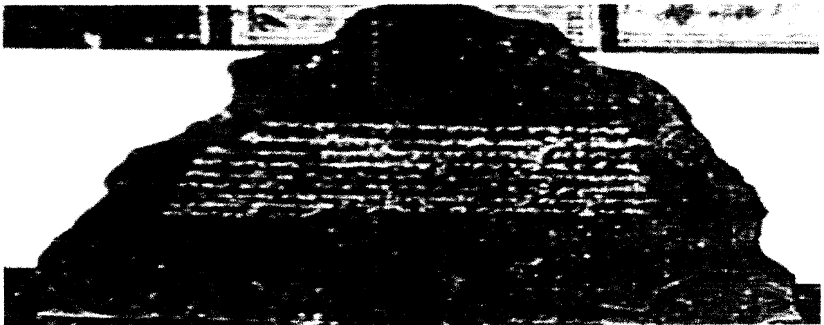
Foto Situs Prasasti Palas Pasemah